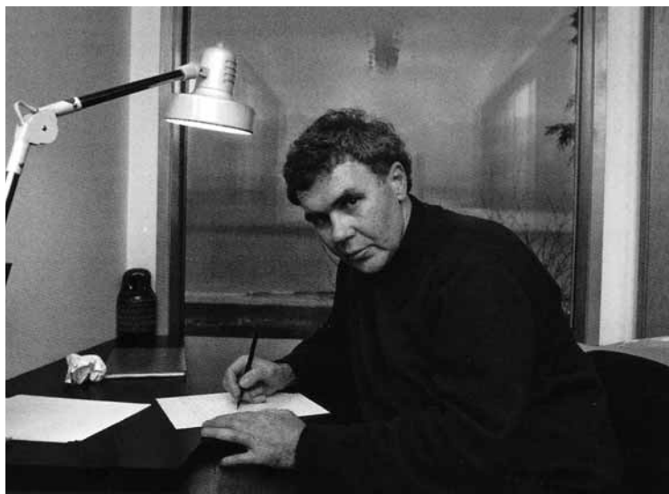
L'écrivain Raymond Carver est un cas. Il a aligné les jobines pour être écrivain et réussir à garder la tête hors de l'eau.

Mais le véritable mécénat, le dévouement d'une Miss Harriet Weaver pour l'œuvre de Joyce et l'intérêt supérieur de la littérature constituent l'exception. Et rares sont les sinécures aussi propices que le poste de gardien de nuit d'une génératrice électrique qui permit à Faulkner d'écrire Tandis que jagonise (Folio). Tout était sans doute plus simple à l'époque où l'on devenait d'abord notable, puis écrivain. Les nombreux médecins de la littérature profi-